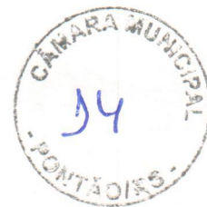
Município de : Pontão - RS PLANO PLURIANUAL 2026 - 2029 Tabela 02 - Estimativas para a Receita Corrente Líquida para fins dos Limites de Pessoal