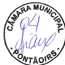
VELTON VICENTE HAHN Prefeito Municipal

Gabinete o Prefeito Municipal, aos 13 dias de março de 2024.